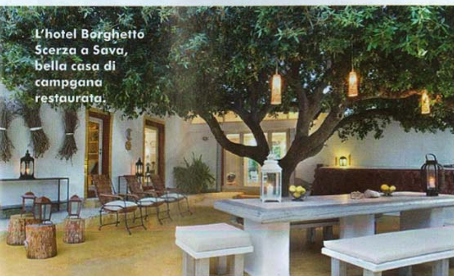
L'hotel Borghetto Scerza a Sava, bella casa di campagna restaurata.