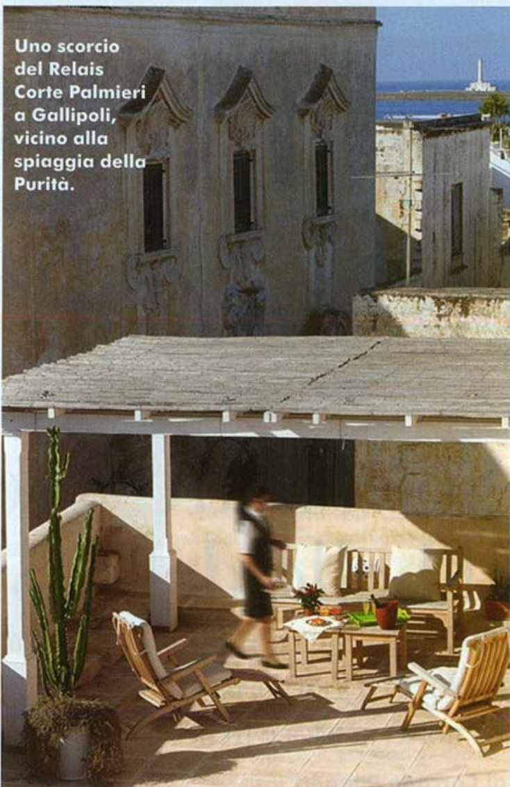
Uno scorcio del Relais Corte Palmieri a Gallipoli, vicino alla spiaggia della Purità.